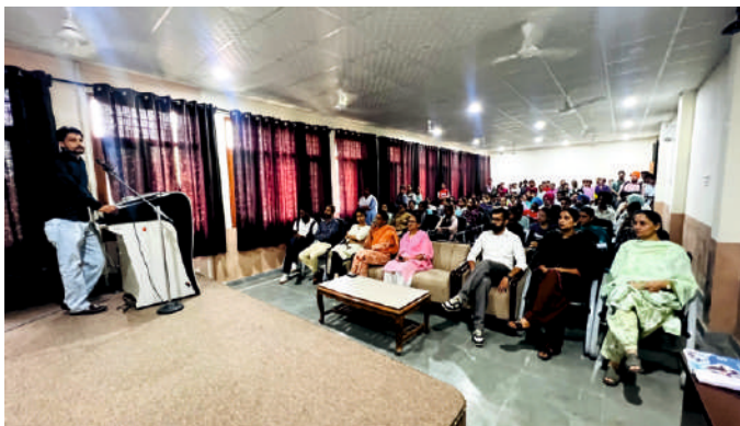
ਕਾਲਜ ਵਿੱਚ ਐਂਟੀ ਰੈਗਿੰਗ ਸਬੰਧੀ ਵਿਦਿਆਰਥੀਆਂ ਨੂੰ ਜਾਗਰੂਕ ਕਰਨ ਲਈ ਐਂਟੀ ਰੈਗਿੰਗ ਵਿਸ਼ੇ ਤੇ ਸੈਮੀਨਾਰ ਕਰਵਾਇਆ ਗਿਆ ।