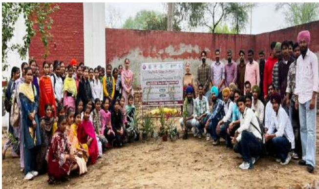
ਵਾਤਾਵਰਣ ਸਿੱਖਿਆ ਪ੍ਰੋਗਰਾਮ 2026 ਅਧੀਨ ਕਾਲਜ ਵਿੱਚ ਐੱਨ.ਐੱਸ.ਐੱਸ. ਵਿਭਾਗ ਵੱਲੋਂ ਪੌਦੇ ਲਗਾਏ ਗਏ।