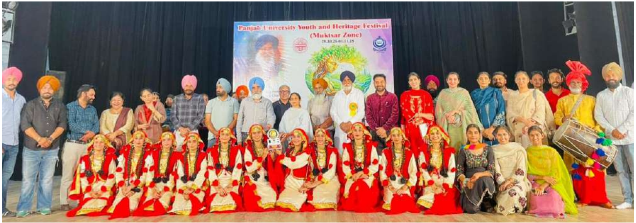
ਜ਼ੋਨਲ ਯੂਥ ਅਤੇ ਹੈਰੀਟੇਜ ਫੈਸਟੀਵਲ ਵਿੱਚ ਕਾਲਜ ਦੀ ਲੁੱਡੀ ਟੀਮ ਨੇ ਦੂਜਾ ਸਥਾਨ ਹਾਸਿਲ ਕੀਤਾ।