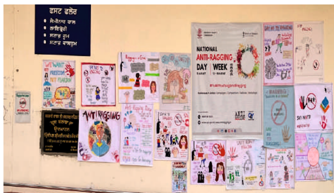
ਕਾਲਜ ਵਿੱਚ ਐਂਟੀ ਰੈਗਿੰਗ ਦਿਵਸ ਮੌਕੇ ਵਿਦਿਆਰਥੀਆਂ ਦੁਆਰਾ ਬਣਾਏ ਗਏ ਪੋਸਟਰ ।