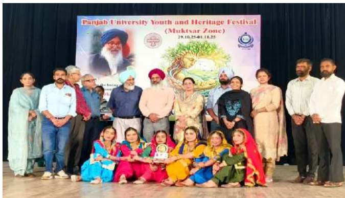
ਲੰਮੀ ਹੋਕ ਮੁਕਾਬਲੇ ਵਿੱਚ ਕਾਲਜ ਦੀਆਂ ਵਿਦਿਆਰਥਣਾਂ ਨੇ ਤੀਸਰਾ ਸਥਾਨ ਹਾਸਿਲ ਕੀਤਾ।