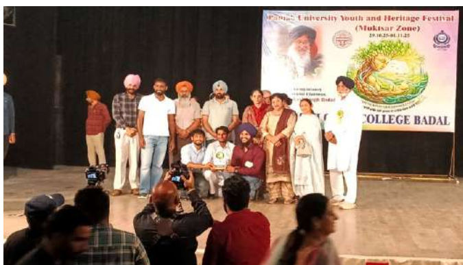
ਕਵੀਸ਼ਰੀ ਮੁਕਾਬਲੇ ਵਿੱਚ ਤੀਸਰਾ ਸਥਾਨ ਪ੍ਰਾਪਤ ਕਰਦੇ ਹੋਏ ਕਾਲਜ ਦੇ ਵਿਦਿਆਰਥੀ।