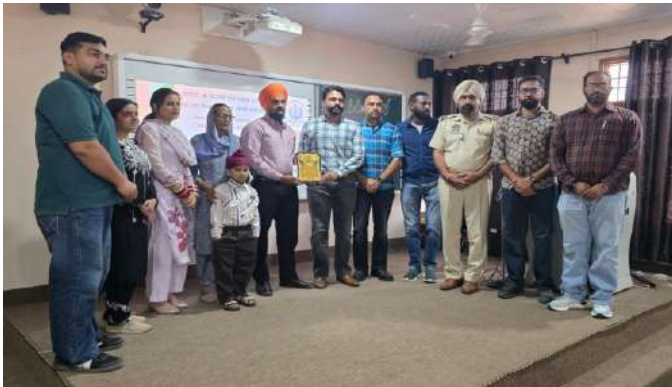
ਸ਼ਹੀਦ ਪੁਲਿਸ ਅਧਿਕਾਰੀਆਂ ਅਤੇ ਕਰਮਚਾਰੀਆਂ ਦੀ ਯਾਦ ਨੂੰ ਸਮਰਪਿਤ ਸ਼ਰਧਾਂਜਲੀ ਸਮਾਰੋਹ ਕਰਵਾਇਆ ਗਿਆ।