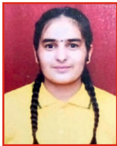
ਚੰਚਲ ਬੀ.ਏ. ਭਾਗ ਦੂਜਾ ਕੁਸ਼ਤੀ ਗਰੀਕੋ ਰੋਮਨ (60 ਕਿਲੋ) ਭਾਰ ਵਰਗ ਵਿੱਚ ਕਾਂਸੇ ਦਾ ਤਗਮਾ ਅੰਤਰ ਕਾਲਜ ਸਪੋਰਟਸ ਮੁਕਾਬਲਾ।