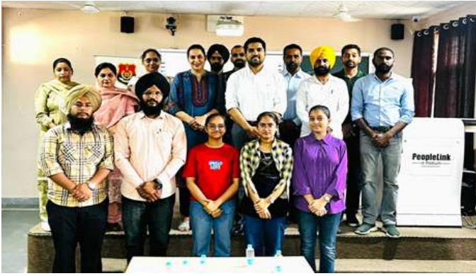
ਸਰਕਾਰੀ ਕਾਲਜ ਵਿੱਚ ਬਡੀ ਗਰੁੱਪ ਦੁਆਰਾ Voice of Organisation ਦੇ ਸਹਿਯੋਗ ਨਾਲ 'ਯੁੱਧ ਨਸ਼ਿਆਂ ਵਿਰੁੱਧ' ਸੈਮੀਨਾਰ ਕਰਵਾਇਆ ਗਿਆ।