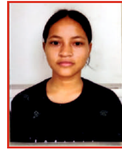
ਗੋਰੀ ਬੀ.ਏ. ਭਾਗ ਪਹਿਲਾ, ਭਾਰ ਚੁੱਕਣ (58 ਕਿਲੋ) ਸੋਨੇ ਦਾ ਤਗਮਾ, ਅੰਤਰ ਕਾਲਜ ਸਪੋਰਟਸ ਮੁਕਾਬਲਾ।