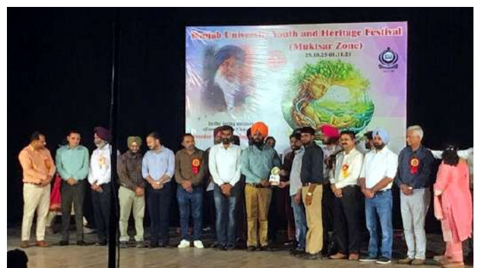
ਕਵਿਤਾ ਉਚਾਰਨ ਮੁਕਾਬਲੇ ਵਿੱਚ ਬੀ.ਏ. ਭਾਗ ਤੀਜਾ ਦੇ ਵਿਦਿਆਰਥੀ ਨੇ ਤੀਜਾ ਸਥਾਨ ਪ੍ਰਾਪਤ ਕੀਤਾ।