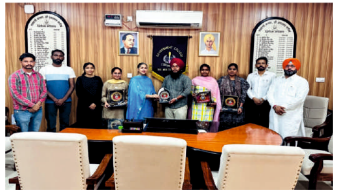
ਗੁਰੂ ਗੋਬਿੰਦ ਸਿੰਘ ਸਟੱਡੀ ਸਰਕਲ ਵੱਲੋਂ ਗੁਰੂ ਤੇਗ ਬਹਾਦਰ ਜੀ ਦੇ ਸ਼ਹੀਦੀ ਦਿਵਸ ਨੂੰ ਸਮਰਪਿਤ ਕਰਵਾਈ ਗਈ ਨੈਤਿਕ ਸਿੱਖਿਆ ਦੀ ਪ੍ਰੀਖਿਆ ਵਿੱਚ ਕਾਲਜ ਵਿਦਿਆਰਥੀਆਂ ਨੇ ਮੈਰਿਟ ਸਥਾਨ ਹਾਸਿਲ ਕੀਤੇ ।