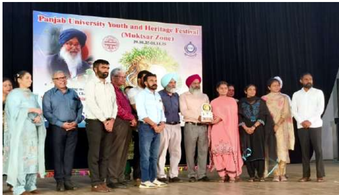
ਬੀ.ਬੀ.ਏ. ਭਾਗ ਪਹਿਲਾ ਦੀ ਵਿਆਰਥਣ ਨੇ ਫੁਲਕਾਰੀ ਮੁਕਾਬਲੇ ਵਿੱਚ ਪਹਿਲਾ ਸਥਾਨ ਹਾਸਿਲ ਕੀਤਾ।