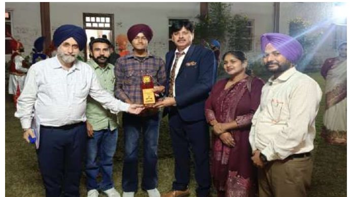
ਬੀ.ਏ. ਭਾਗ ਪਹਿਲਾ ਦੇ ਵਿਦਿਆਰਥੀ ਨੇ ਖਿੱਚੋ ਬਨਾਉਣ ਮੁਕਾਬਲੇ ਵਿੱਚ ਜ਼ੋਨਲ ਅਤੇ ਅੰਤਰ ਜ਼ੋਨਲ ਯੂਥ ਅਤੇ ਹੈਰੀਟੇਜ ਮੁਕਾਬਲੇ ਵਿੱਚ ਪਹਿਲਾ ਸਥਾਨ ਹਾਸਿਲ ਕੀਤਾ।