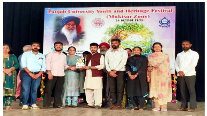
ਐੱਮ.ਏ. ਰਾਜਨੀਤੀ ਸ਼ਾਸਤਰ ਭਾਗ ਦੂਜਾ ਦੇ ਵਿਦਿਆਰਥੀ ਨੇ ਪਰਕਸ਼ਨ ਮੁਕਾਬਲੇ ਵਿੱਚ ਤੀਜਾ ਸਥਾਨ ਪ੍ਰਾਪਤ ਕੀਤਾ।